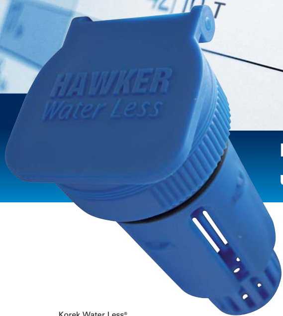
Korek Water Less®

Dłuższy czas użytkowania – Mniejsza częstotliwość uzupełniania poziomu elektrolitu