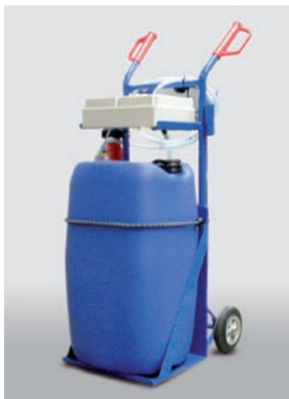
Wózek z zasobnikiem wody dostępny w wersji zasilanej prądem przemienicznym lub stałym